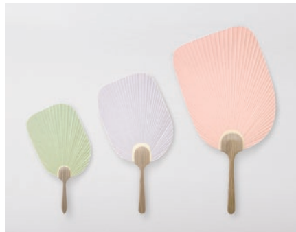
京うちわ Ojigi パステル

定番の金魚のほかに、海の中をイメージした貝殻をモチーフにした Ojigi です。