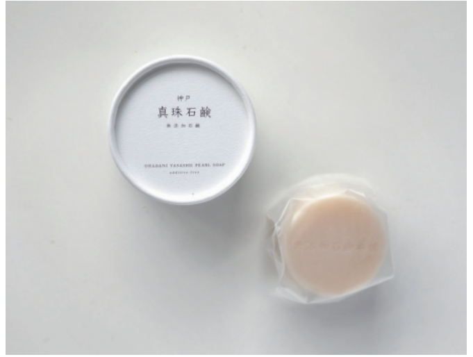
無添加洗顔石鹸 神戸 真珠石鹸

あなたと一緒に旅する石鹸。キャラメルのような小さな石鹸は、一粒だけ持って行くもよし、箱ごと持って行くもよし。鞆にそっと忍ばせてください。食品原料だけを使った無添加石鹸です。