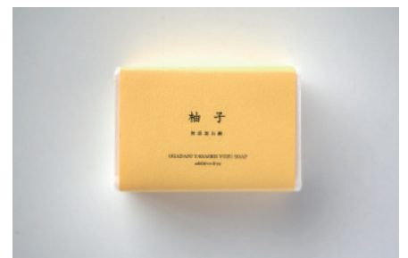
コールドプロセス 柚子石鹸

カテキン・ビタミンを多く含む緑茶葉の粉末を配合。ほのかな茶葉の香りですっきりとした洗い上がりです。