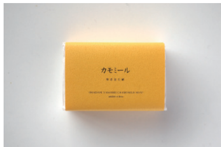
コールドプロセス カモミール石鹸

見た目も香りも桜餅のようなかわいい石鹸。ピンクの色は天然の赤土(レッドクレイ)。赤土の細かい泥が毛穴の汚れまで吸着してさっぱり落とします。