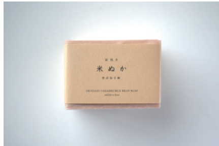
釜焚き 米ぬか石鹸

つるつるすべすべの洗い上がりで非常にキメの細かい泡立ちが特徴。真冬でもつっぱらず、お肌の弱い方、敏感な方にも。