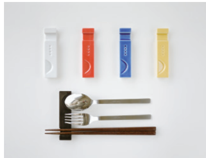
カトラリーレスト

おもてなしの心と晴れの器のシリーズ。"ホッと一息"を演出する緊張感と優しさの同居する急須です。蓋を広く取りお手入れをしやすくしています。