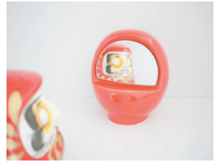
smile smile smile