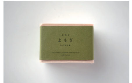
釜焚き よもぎ石鹸

兵庫県温泉町のアイガモ農法で育てた無農薬米ぬかをたっぷり配合。お肌にやさしいロングセラー商品です。