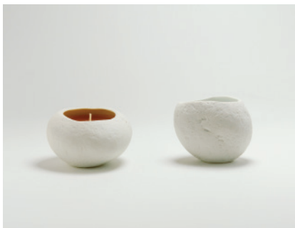
SASSO アロマキャンドル

お殿様・お姫様の着物をまとったフラワーベースです。草木や花を生けることで、色々な表情が生まれます。