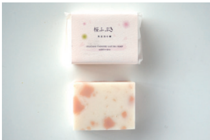
コールドプロセス 桜ふぶき石鹸

灘の老舗酒造「福寿酒造」の純米大吟醸と六甲布引の名水を配合。さらに国産椿油・ヒマシ油など厳選素材を使用。粘り気のあるもっちり泡が特徴です。