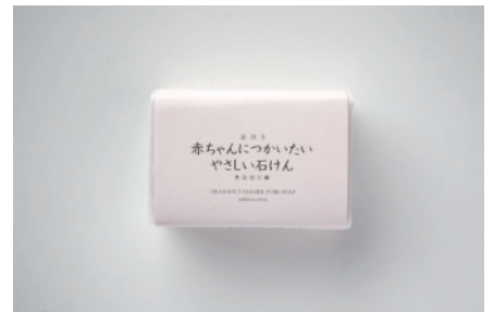
釜焚き 赤ちゃんにつかいたいやさしい石鹸

天然ラベンダーの精油を配合。釜焚き製法のすべすべした洗い上がりとはほのかな香りが特徴です。柔らかな泡でふんわりとした洗い上がりです。