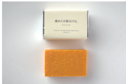
コールドプロセス 疲れたお肌石鹸

リラクセスできる優しい香りのラベンダーの天然精油を配合。しっとり系の配合で、優しい泡と柔らかかな使用感をお楽しみ頂けます。