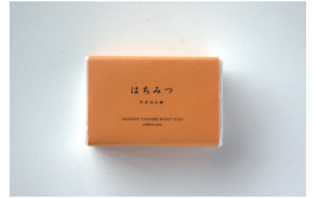
コールドプロセス はちみつ石鹸

天然飼料で愛情たっぷりに育てたヤギのミルクを配合。母乳に近い成分で小さなお子様やお肌が敏感な方にもお勧め。香りもなく泡立ちはクリーミーです。