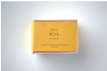
釜焚き カミツレ石鹸

和の万能ハーブであるよもぎ葉エキスと保湿成分グリセリンを配合。米ぬか石鹸と比べしっかりと洗いがります。