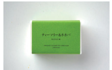
コールドプロセス ティーツリー&amp;ホホバ石鹸

天然カモミール末をそのまま配合。化学香料ではない本物の自然の香りと製法特有の優しい洗い上がりの石鹸です。