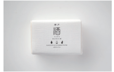
コールドプロセス 神戸 酒石鹸

六甲山に1年に2週間しか採れない上質なアカシア蜂蜜を配合。蜂蜜の天然の果糖成分とシアバターやホホバ油などでお肌がしっとりと洗い上がります。