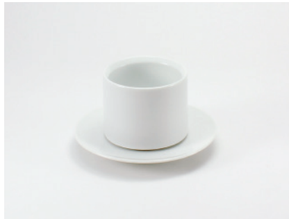
SUI 煎茶カップ&ソーサー

熱い飲み物でも心地よいぬもりを感じることができる、本格的なヌメ革を着せたコントラストの美しいカップです。