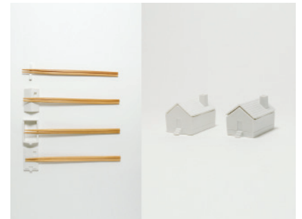
House for chopsticks