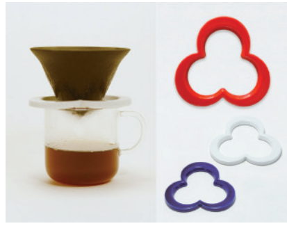
Caffè hat コーヒードリッパー

その永い歴史の中で磨かれてきた技術のバックボーンが肥前吉田焼の最大の特徴であり、様式にとらわれない自由なものづくりを可能にしています。