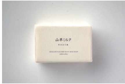
コールドプロセス やぎミルク

コールドプロセス製法はレシピが命。配合物の性質を見極め、それぞれの特徴を引き出す配合を作り出します。天然保湿成分であるグリセリンを豊富に配合する製法ですので洗い上がりはしっとりと仕上がります。