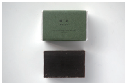
コールドプロセス 緑茶石鹸

まるでひのき湯に入っているような香りが楽しめるひのき石鹸。天然ヒノキの精油を贅沢に配合しました。