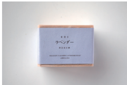
釜焚き ラベンダー石鹸

厳選された天然・良質のカモミールを配合しました。消炎作用があると言われ、お肌が荒れ気味の方にも薦めます。