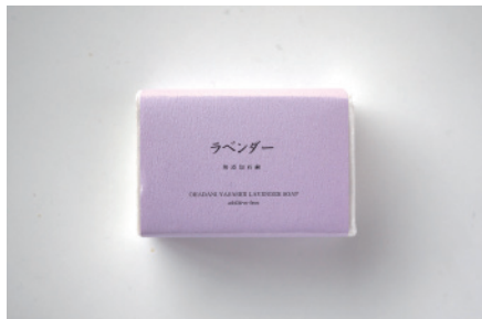
コールドプロセス ラベンダー石鹸

天然の保湿成分でもある蜂蜜をたっぷりと配合。ほのかな甘い香りですっきりと優しく洗い上がります。