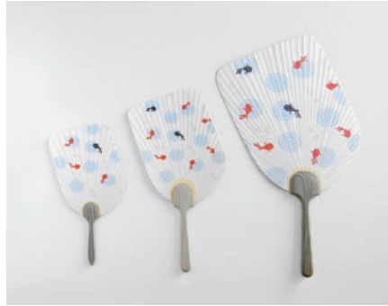
京うちわ Ojigi 金魚

都京都で創作され伝承されてきた京うちわ。別名「都うちわ」とも言われながら、京都の風土と文化に生まれながら優美な風を送り続けています。その京うちわの持つ職人の技と伝統を守りながら、今では貴重になっている国産材にこだわり、新しい京うちわの Ojigi が誕生しました。