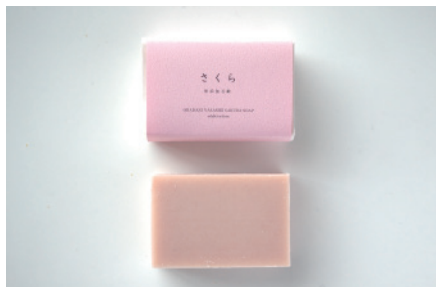
コールドプロセス さくら石鹸

柿渋パウダーと緑茶葉を配合。W カテキンが体臭の元となる皮脂を落とし、さっぱりと洗い上がります。