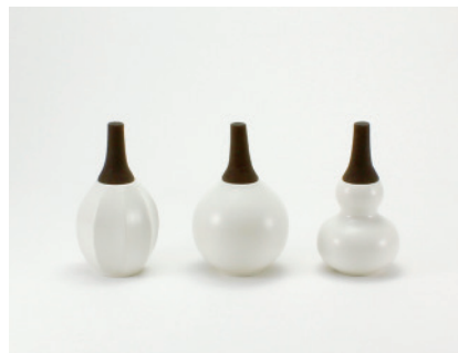
Fragrance pot アロマディフューザー

石のかたちのアロマキャンドルです。部屋の片隅にコロンと在るだけで、その愛らしい形とアロマの香りが、優しく心を和ませてくれます。