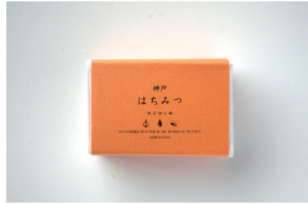
コールドプロセス 神戸 はちみつ石鹸

お客様の声からできた石鹸でオリーブオイルベースのシンプル石鹸。オーガニック原料を使用しており赤ちゃんや敏感肌にもお勧め。