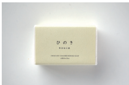
コールドプロセス ひのき石鹸

殺菌力の高いティーツリー油を配合。爽やかな香りにしっとり成分のシアバターやホホバを配合。ニキビなど気になる方にも人気。