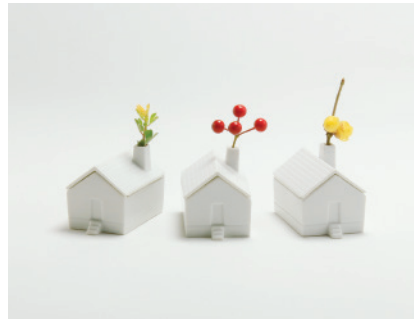
House for flower

本たちにしてあげられることはないかな？ 本棚に花を一輪。 文庫本サイズの本のようなフラワーベースです。