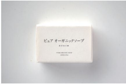
コールドプロセス ピュアオーガニック