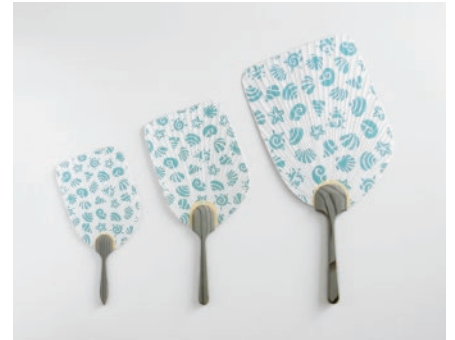
京うちわ Ojigi 貝殻

京都のうちわで涼しげな柄の Ojigi を作ってみました。丸亀うちわとは取っ手のつくりが違います。夏といえば金魚です。