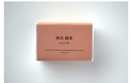
コールドプロセス 柿渋緑茶石鹸

オレンジ油とスペアミント油、さらに蜂蜜とアロエベラエキスを配合し、すっきりとした洗い上がりの後にしっとりと仕上がります。